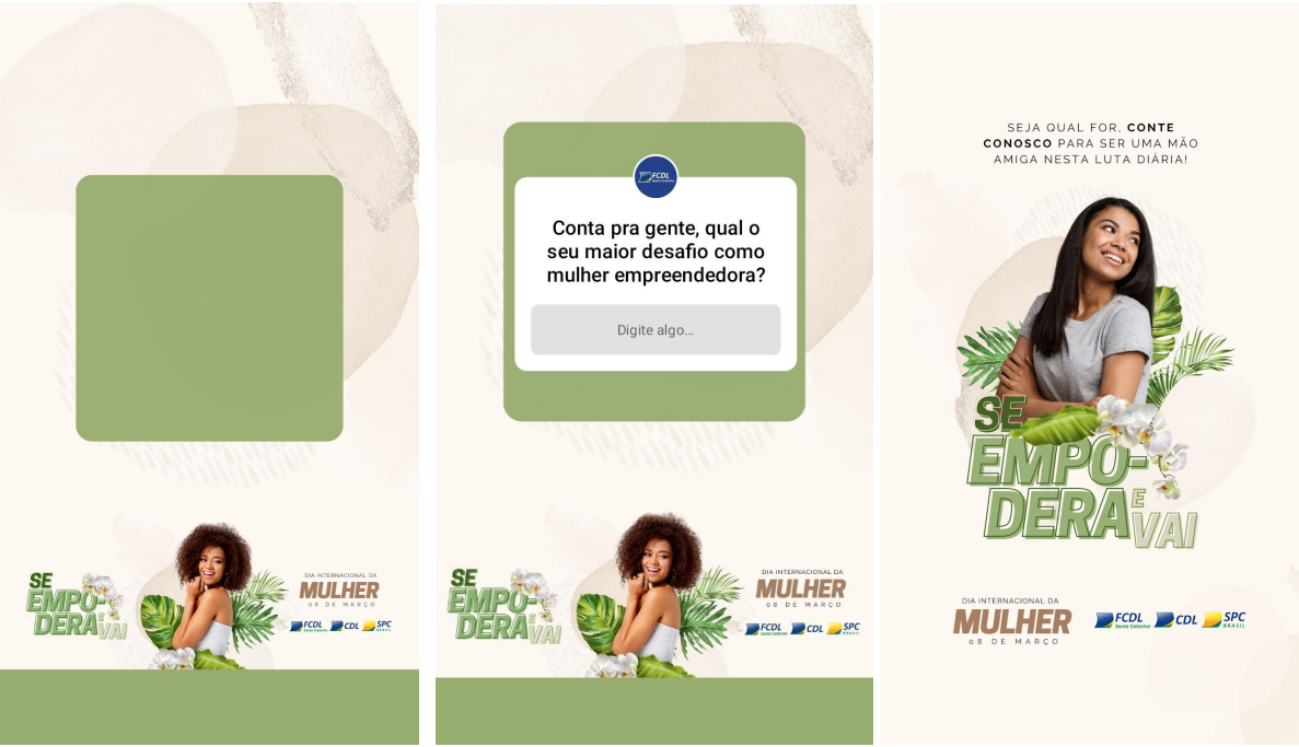
post5 - Carrossel